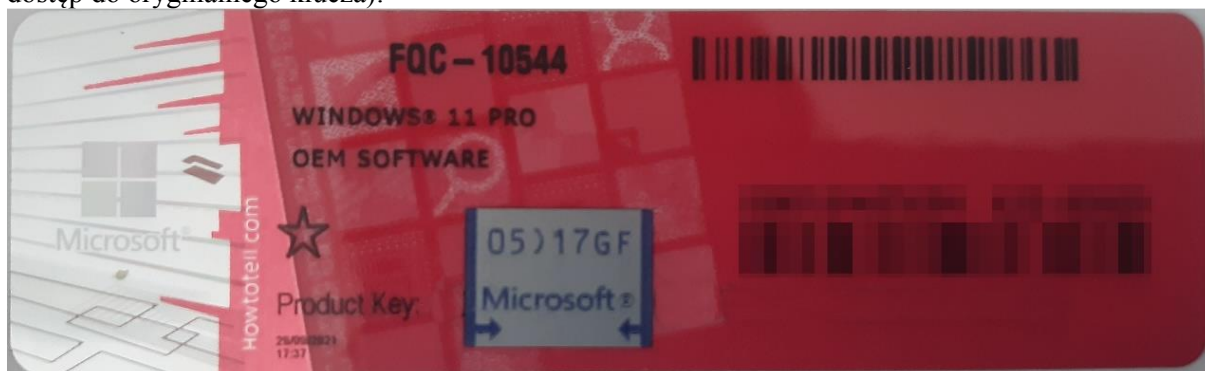
Rys. 1 przykładowy kod zabezpieczony przez producenta systemu Microsoft Windows 11 (takie same naklejki mają Windows 10) z wymazanym, znajdującym się przed i za szarą naklejką kodem licencyjnym

Poniższe zdjęcie obrazuje obecnie stosowane zabezpieczenia producenta firmy Microsoft (klucz systemu jest zabezpieczony naklejką hologramową przez producenta. Po jej zdrapaniu uzyskujemy dostęp do oryginalnego klucza):