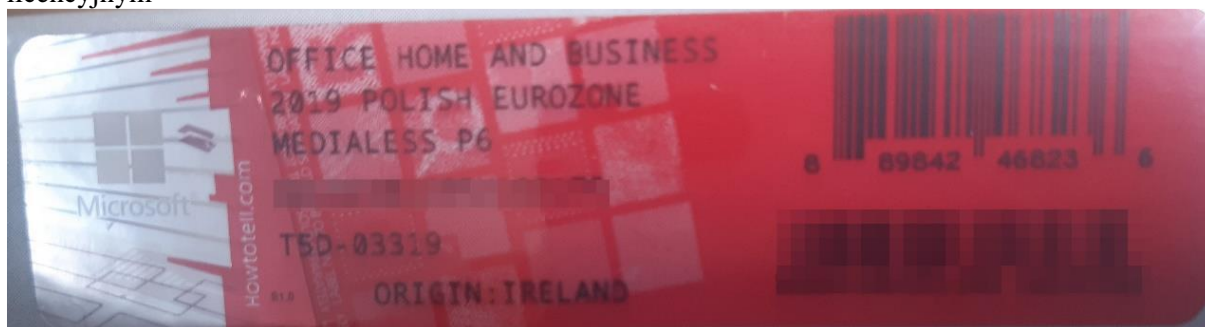
Rys. 2 przykładowy kod zabezpieczony przez producenta systemu Microsoft Windows Office Home&Business z wymazanym, znajdującym się w prawym dolnym rogu numerem seryjnym produktu. Kod licencyjny znajduje się w środku szczelnie zapakowanego i zafoliowanego pudełka (Rys. 3)